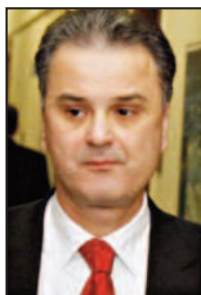
Ο αναπληρωτής υπουργός Ανάπτυξης, Ανταγωνιστικότητας και Ναυτιλίας κ. Σ. Ξυνίδης.

Μ έχρι το Μάιο του 2012 θα πρέπει να έχει υποβληθεί στην πολιτική ηγεσία του υπουργείου Ανάπτυξης Ανταγωνιστικότητας και Ναυτιλίας σχετική πρόταση νομοθετικού κειμένου για την τροποποίηση και συμπλήρωση του Αγορανομικού Κώδικα.