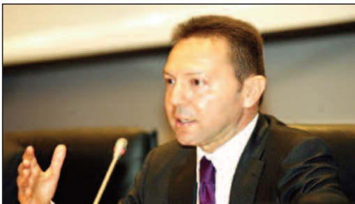
Ο πρόεδρος του ΙΟΒΕ Γιάννης Στουρνάρας.

Το λιανεμπόριο συνεχίζει να δέχεται τη μεγαλύτερη πίεση από την κρίση, όπως δείχνει η έκθεση του ΙΟΒΕ για το οικονομικό κλίμα το Μάιο. Αμετάβλητος ο δείκτης σε σχέση με τον προηγούμενο μήνα.